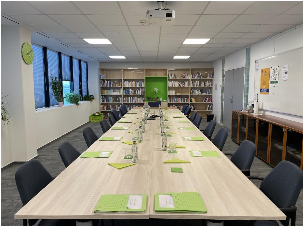
Salle de conférence